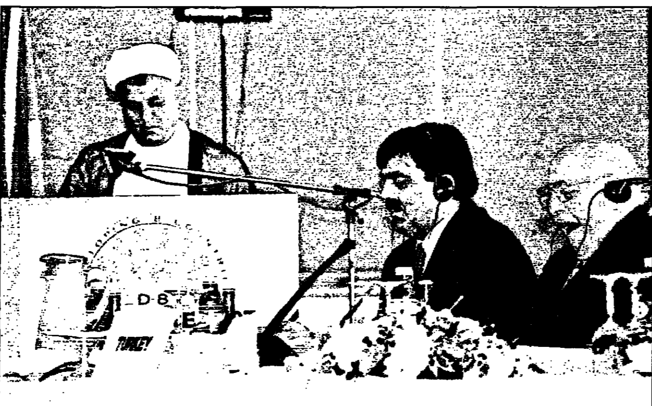
رئيس وزراء تركيا يتكلم بينما يلقى الرئيس الإيراني خطاباً أمام قمة مجموعة الثمانية في اسطنبول أمس

كما ينص ما أعلن اسطنبول على مشاورات سياسية متسقة في العلاقات الدولية بين الدول الأعضاء. وتعد هذه هي المرة الأولى التي توقع فيها مصر وايران على وثيقة تجمعها اقتصادياً وتحدد مجالات التعاون في مختلف المجالات منذ قطع العلاقات بين البلدين عام 1979. ومن المقرر ان يعقد اجتماع ثامن لهذه المجموعة في تشرين الثاني (نوفمبر) - كانون الأول (ديسمبر) 1998 في تركيا. ويشارك في هذه المجموعة بالإضافة إلى الرئيس التركي سليمان ديميريل كل من الرئيس الإيراني علي أكبر هاشمي رفسنجاني والرئيس العراقي صدام حسين ورئيس الوزراء المصري محمد مبرور وماليزيا وباكستان وبنما وجمهورية كوريا الشعبية الديمقراطية وكوبا وكندا والجزيرة العربية ومصر وبنما وتونس وشربل. أما توجيريا فلن يشارك فيها. وقال كوهين إن هذه المجموعة هي «أفضل القوات الأمريكية في العالم» وأنهم «يتمتعون بأفضل التدريب في العالم».